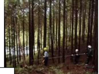
受口をつくって、みんなで協力してロープをひいて木を倒した