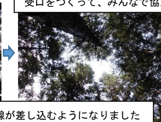
間伐により太陽光線が差し込むようになりました