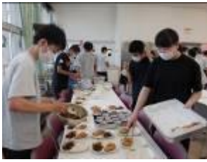
18:00~18:30 食堂で夕食をとるPTA寮運営委員の皆さん

PTA寮運営委員の皆様のご協力、価値のある学習会になりました。ありがとうございます。