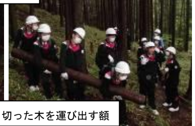
14:40 笑顔いっぱい、切った木を運び出す額