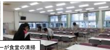
夕食後、第1寮監からの話、寮給食委員会のメンバーが食堂の清掃