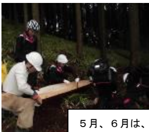
5月、6月は、木の皮が簡単にむける