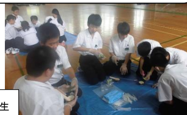
ブロッコリーの細胞からDNAを取り出す実験に真剣に取り組む1年生