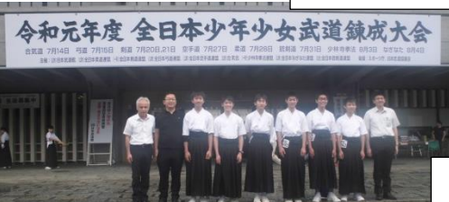
大会後、外部指導者のK先生から一言