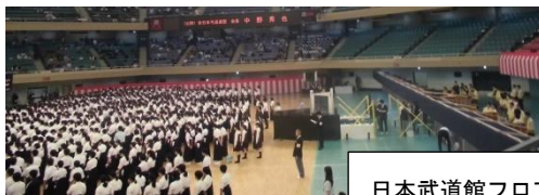
日本武道館フロアに8射場

額田中学校弓道部男子 予選12射中4射(6射以上で決勝進出) 決勝進出まであと一步 予選敗退