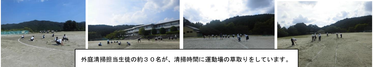
外庭清掃担当生徒の約30名が、清掃時間に運動場の草取りをしています。