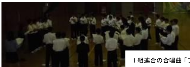
1組連合の合唱曲「プレゼント」