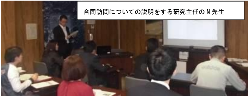
合同訪問についての説明をする研究主任のN先生