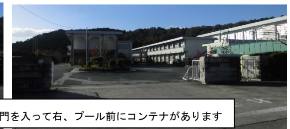
正門を入れて右、プール前にコンテナがあります