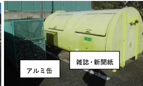
アルミ缶 雑誌・新聞紙

牛乳パック・段ボール、アルミ缶・雑誌・新聞紙の5種類に限り、資源回収を行っています。今年度から常設で、登下校及び部活動の送迎時、保護者会の折に持ってきてコンテナに入れてください。