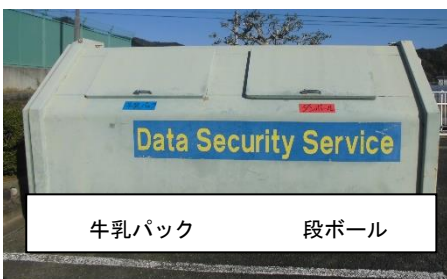
牛乳パック 段ボール