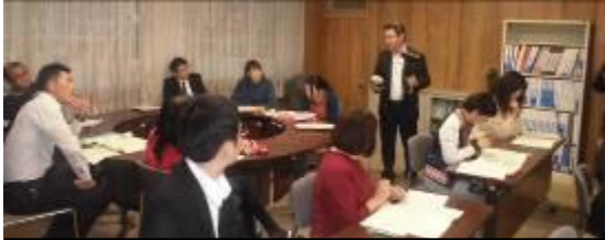
公開授業のビデオ撮影の説明をする研究副主任のS先生