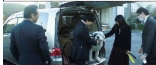
向さんを見送る時、犬に癒される先生