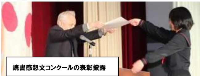
読書感想文コンクールの表彰披露