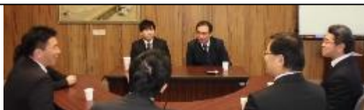
1月11日(土)教育講演会后、教職員とのCRS