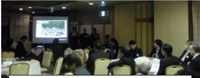
平成31年2月5日(火) 於 岡崎ニューグランドホテル