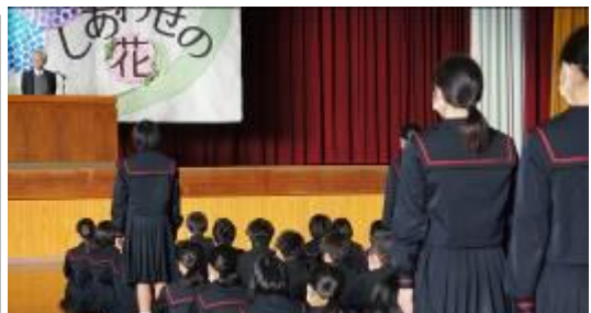
表彰される生徒は、大きな声で返事をして立ちました

第54回岡崎市小中学校読書感想文コンクールにおいて優秀な成績を収めた生徒の表彰披露を行いました。1年生は3名、2年生は2名、3年生は2名を表彰しました。