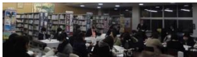
地区委員、実行委員の選出の提案に対する協議

平成31年1月16日(水)に第5回PTA実行委員会を開催し、PTA会員にご協力いただいたアンケートをもとにPTA地区委員、実行委員等の選出方法について話し合いました。その結果、ある程度の方角性を見出すことができました。この分析結果と方向性について、1月23日(水)の第2回PTA常任委員会で報告し、今後のPTA地区委員、実行委員の選出について共通理解を図ることができました。また、平成30年度のPTA活動の反省を生かして、平成31年度のPTA活動の計画づくりを行いました。PTA地区委員、実行委員の皆様のおかげで、額田中学校PTA活動が順調に進んでいます。本当にありがとうございます。