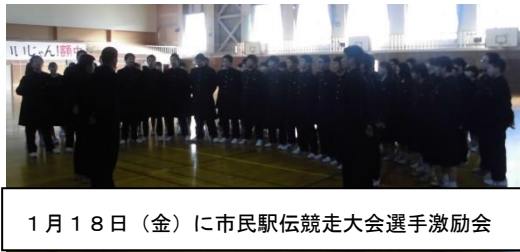
1月18日(金)に市民駅伝競走大会選手激励会