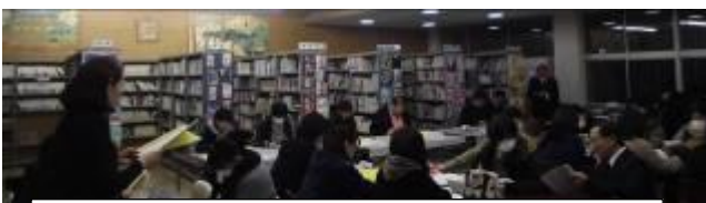
委員長から各委員会活動の反省と次年度の計画の報告