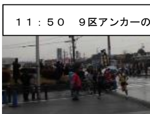
11:50 9区アンカーのゴール