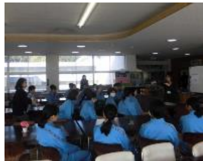
岡崎市視覚障がい者福祉協会

11月21日(水)の午後、3年生は、総合的な学習の時間で「福祉実践教室」を実施しました。「車椅子講座」、「視覚障がい者ガイド講座」、「手話講座」の3つの講座に分かれて、実際に、障がい者の立場になって体験活動を行いました。思いやりの心で、相手が幸せになる言動に心掛けていくことの大切さを再認識しました。