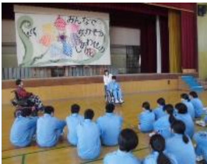
ほくらの障がい知ってもらい隊 アンダンテ