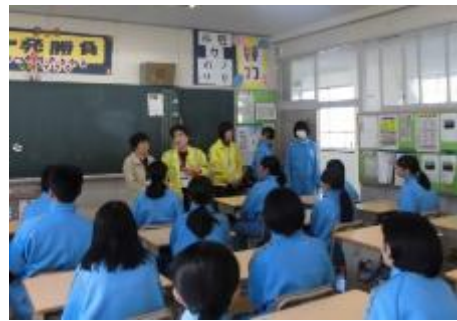
岡崎ひとみ会 岡崎市視覚障がい者福祉協会