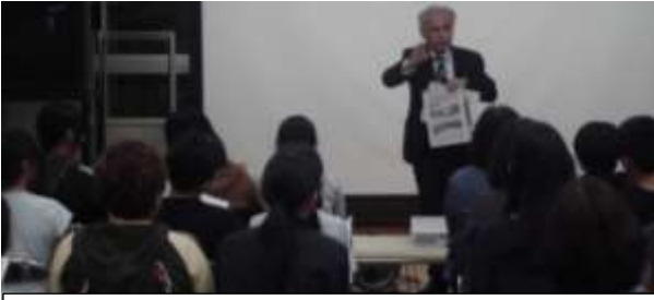
「敬信寮」は人を尊敬し、信頼することを学ぶ場である。