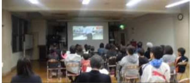
寮生活の様子のビデオを視聴する寮生地区6年生と保護者

11月8日(木)、19:10~20:30、平成30年度寮生地区小学校6年生が、額田中学校の「敬信寮」の参観をしました。この寮参観を通して、平成31年度「敬信寮」に入寮するかを判断し、平成31年1月9日までに入寮申請することになります。寮生活の様子のビデオを視聴してから、6年生とその保護者は、中学校2年生の説明を聞きながら寮内を参観しました。平成31年2月18日(火)に額田中学校入学説明会と入寮説明会が開催される予定です。