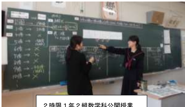
2時限 1年2組数学科公開授業