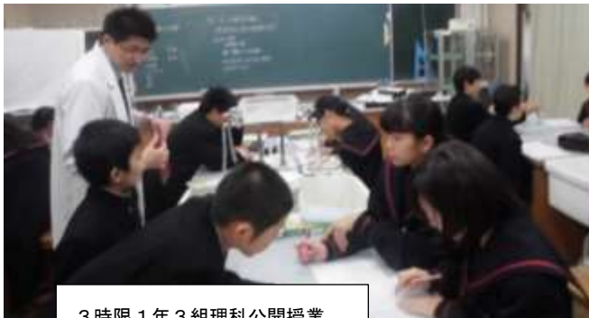
3時限 1年3組理科公開授業