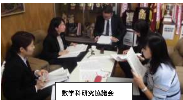
数学科研究協議会