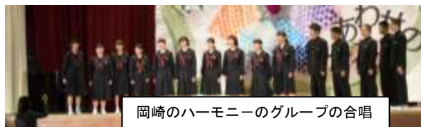
岡崎のハーモニーのグループの合唱