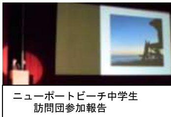
ニューポートビーチ中学生訪問団参加報告