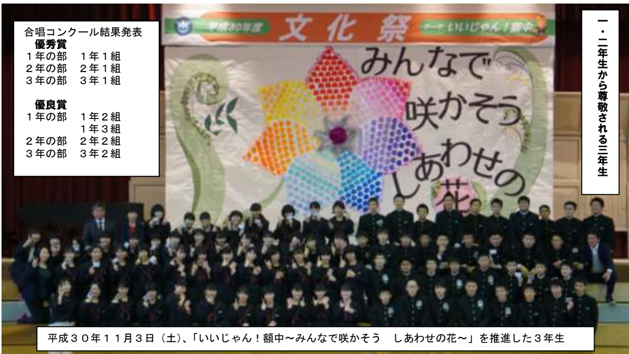
平成30年11月3日(土)、「いいじゃん! 額中~みんなで咲かそう しあわせの花~」を推進した3年生