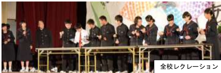
全校レクリエーション 12:40