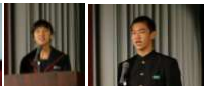
国語主張コンクールに出場した生徒