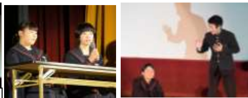
岡崎市中学生英語スピーチに出場した生徒の発表