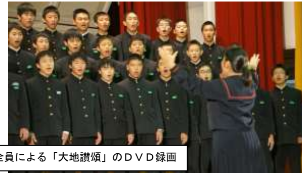
10:50 3年生全員による「大地讃頌」のDVD録画