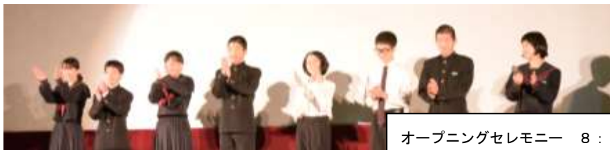
オープニングセレモニー 8:50

平成30年10月20日の第15回チャリティー岡崎おやじ杯ソフトボール大会で、「額田中おやじの会」が優勝したことの報告を兼ねて表彰披露しました。