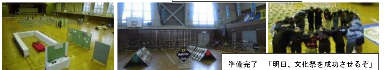
準備完了 「明日、文化祭を成功させるぞ」

11月2日(金)、全校生徒が、午後に文化祭の会場準備をしました。「自分たちで文化祭をつくりあげるのだ」という意気込みが伝わってきました。約50分間、体育館の椅子と机を並べて、美術、技術家庭科、理科作品を展示しました。すべての準備完了の段階で、文化祭実行委員と教職員が、文化祭の成功を祈念して気合いを入れて、円陣を組み、心をつにさせました。