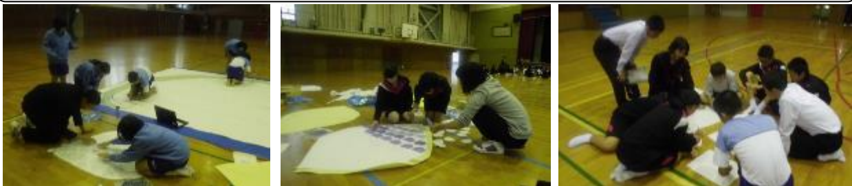
全校制作に真剣に取り組み、全校レクレーションの事前打ち合わせをする文化祭実行委員