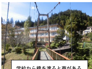
学校から橋を渡ると寮がある