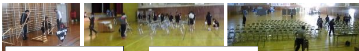
おかざきっ子展の作品展示の準備