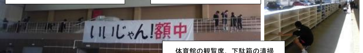
体育館の観覧席、下駄箱の清掃