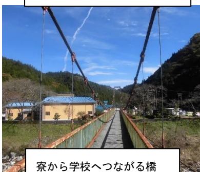
寮から学校へつながる橋