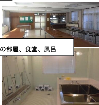
「志高寮」の部屋、食堂、風呂