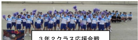
3年2クラス応援合戦