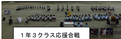
1年3クラス応援合戦