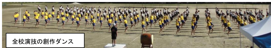
全校演技の創作ダンス