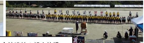
全校演技の組立体操