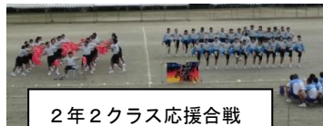
2年2クラス応援合戦