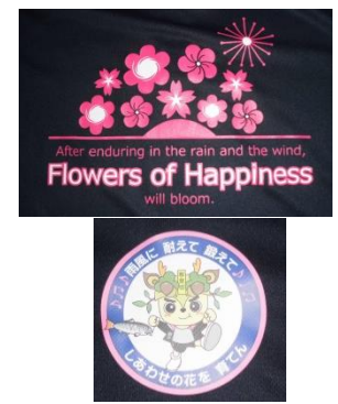
最後の体育大会に全力を尽くし、笑顔の花を咲かせた3年生。 職員Tシャツのデザイン(長谷川教頭先生) 英訳(森本先生)