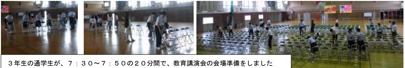
3年生の通学生が、7:30~7:50の20分間で、教育講演会の会場準備をしました

保護者の皆様には本校の教育活動にご理解とご協力に感謝申し上げます。今後ともよろしく願います。