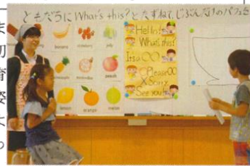
外国語活動の授業(2年)

ここでは、3人の学級担任の指導記録をあげました。まず、5年の学級担任の記録は、4月当初から一貫して子どもの学びへの立ち向かい方を育てようとしてきたもので、子どもたちの成長の姿が目に見えてきそうです。特に、子どものよさを生かしながら、高学年としての育ちをねらっているところに、今後の期待が高まります。