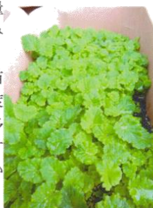
サクラ草の発育状況

昨年度の卒業式、今年度の入学式で使いましたサクラ草の苗も順調に育ってきています。現在のところ、右のように昨年度以上の出来映えですので、今年度の卒業式で使う苗の数より多くのものが育ちそうです。これについても、ご家庭にお分けする予定です。なお、サクラ草は、夏の暑さ対策、水やり、夏から秋の害虫駆除が発育の大きなポイントとなります。秋の11月頃にまたお知らせをしますので、楽しみにしていただければ幸いです。