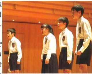
これが最後で最高の演奏

「台風は考える」という曲は、先生とともに4人で何度も何度も練習してきたものです。その成果が、コンクールのたびに確実に見られ、確かな上達をしてきました。特にこの場では、4人それぞれがしっかりと