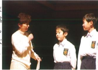
インタビューに答える2人