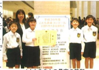
4人と先生との最高の笑顔