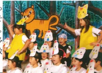
1年「ブレーメンの音楽隊」

今回は、この学芸会の一連の練習・本番を通して、多くの子どもたちの成長が見られました。その内容が、教師の指導の記録に表れていましたので、紹介します。