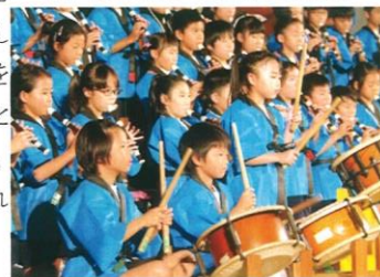
3年「梅っ子まつりだ！ わっしょい！」

学芸会の練習期間で大きく変容したのはA君でした。練習が始まった週は、練習に参加するのをいやがり、実際には、教室で学習することが時々ありました。しかし、本番が迫ってくるにたが、担当の先生の指示をよく聞き、その指示に従い、友達よりも早く仕度ができるようになりました。まだなかなか気持ちをコントロールできないところもあり、心配していましたが、A君は、自分なりに気持ちを切り替えて練習に参加することができるようになりました。これは、A君の大きな成長の姿でうれしく思いました。少しずつコントロールできる場面を増やしていきたいです。