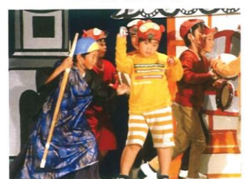
2年3組「たぬきばやし」