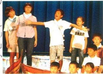
5年「十五少年漂流記」