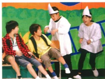
4年1組「ヒュードロン お化け学校」