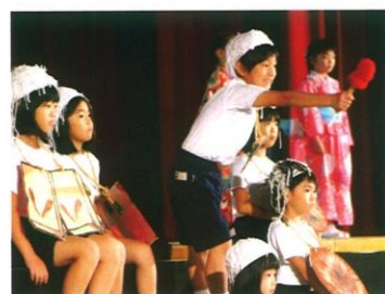
2年1組「たわしのかみさま」