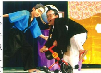
2年4組「自転車にのったとのおさま」

前日より「明日、緊張する」と、学芸会のことをとても意識している様子が伝わってきました。本番当日は、朝から異様にテンションが高く、家の人に見てもらおうことを楽しみにしている様子でした。演技は、思いっきりやっている子ばかりで、終わった後の笑顔が輝いて見え、力を出し切ったことができたと思いました。作ったお面を大事そうに抱えて帰る姿からは、練習の中でつらい思いをしたかもしれませんが、この「ブレーメンの音楽隊」の音楽劇が大好きで、楽しんでやることができたように感じました。また、学芸会の練習中、次にどのように行動するか、何を持ってくるかなどの指示があったり、振り付けや立ち位置のことで指示されることがありました。それを聞き逃さないように、集中して聞くことで、「聞く力」が身についたように感じます。それをこれからの学校生活に生かしていきたいと思います。