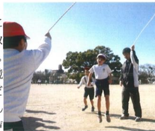
長なわ跳びの練習風景(1年)

3つ目に「なわとび大会」です。このなわとび大会に向けて、現在の個人のなわとび検定の上位級に向けた取り組みと、学級での長なわ跳びの練習が行われています。そして、なわとび大会では、学級対校の長なわ跳びを競い合うとともに、なわとび検定の上位級に達成した子どもたちが全校の前でなわ跳びを発表します。ふたばさんは、なわとび大会に向けて、特に長なわ跳びを学級で声を掛け合ってがんばろうとしています。それは、2年3