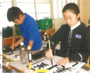
書き初め大会の風景(4年)

1・2年生は硬筆習字、3～6年生は毛筆習字です。学年に応じたお手本を基にして真剣な姿が見られました。ふたばさんは、この書き初め大会に向けて日頃から字を丁寧に書くようにしてきたのですね。さて、金賞が取れたでしょうか。努力の成果が見られるとよいですね。な