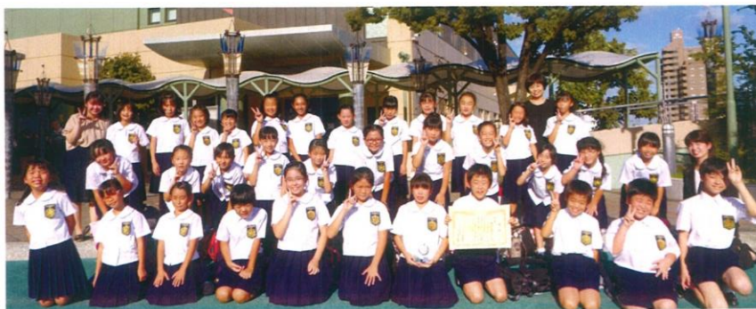
Nコン東海北陸ブロック銀賞を獲得した音楽部