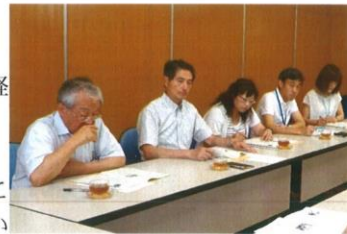
学校評議員の皆様

今回は、6月20日（木）に本校で開催しました。本年度初めてですので、まず、私が本年度の学校経営方針について簡単に説明させていただきました。その中では、1学期の現時点までの学校の状況等、具体的には、入学式、学級代表・委員長の任命、このほり集会、なかよし集会、大運動会、あじさい読書等での子どもの様子に加えて、2年後の梅園小開校150周年記念事業の予定も含めて説明しました。