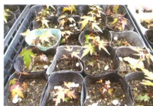
カエちゃん(かえで)の苗木