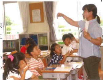
参観授業の一場面