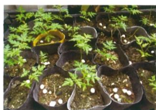
ガウスくん(センダン)の苗木