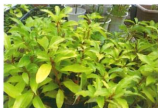
くすくん(くすのき)の苗木

くすくん、カエちゃん、梅の苗木については、これまでもお配りしてきました。ガウスくん(センダン)は、昨年、紫の花を咲かせ、実がなり、それから出た芽を苗にしました。イチョウは、大正時代に同じ頃植えられたと思われる附属小学校のイチョウの銀杏から出た芽を苗にしました。