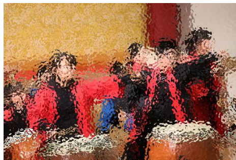
【和太鼓クラブ：花火・常南そろい打ち】

私たちは、ときなん祭に向けてがんばってきたことが二つあります。一つ目は、ダンスの曲を決めることです。五年生の中で好きな曲を出し合い、みんなで決めました。二つ目は、ダンスの振り付けを覚えることです。ダンスの振り付けは、男子役と女子役に分かれ、私は男子役をやっています。男子役は、前後や左右の移動が多くて、難しかったです。本番では、見に来てくれた方にダンスの楽しさ、そして元気を与えられるように全力でおどりたいです。