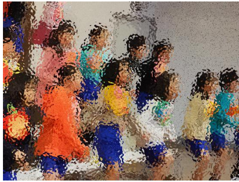
【2年：ここはの森からこんにちは】