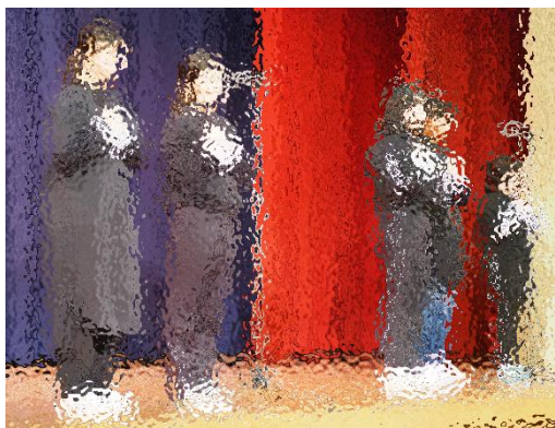
【音楽クラブ：手話ソング】

私たちがクラブを始めたころ、新型コロナウイルス感染症によって、歌うことや楽器を演奏することがほとんどできませんでした。今回も手話での発表練習をしてきましたが、感染状況も改善されてきたので歌ってもよいことになりました。せっかく歌えるのだから、最高のものにしたいたいと思い、休み時間を使って何度も練習しました。まだ歌いながら手話するのは難しいですが、本番ではどちらも成功させたいと思います。