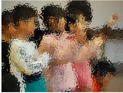
【1年：スーパー1年生参上!!】

わたしは、ときなんさいでなわとびをひろうします。あやとびを見てもらいたいので、れんしゅうをがんばっています。あやとびはとてもむずかしいです。まだあまりとべないので、ともだちといっしょに、れんしゅうをたくさんしています。みんなで「こいぬのマーチ」をえんそうしたり、うたをうたったりもします。みんなががんばって、すてきなところをいっぱい見てもらいたいです。