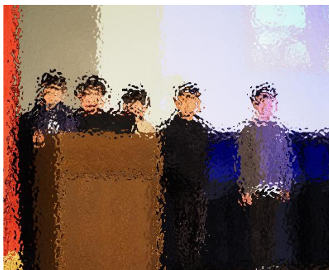
【プログラミングクラブ：Let's ゲームメイキング】

なん祭で発表しよう決めました。一番苦労したのは、てきの大きさや、動く速さなど、細かなプログラムを調節することでした。今年はずりでしたが、次はパソコンでプログラミングをするので楽しみです。