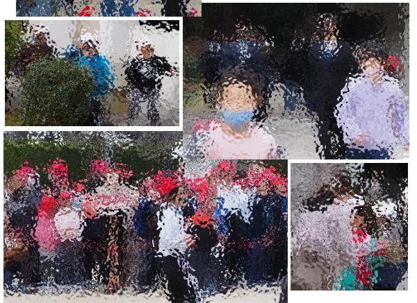
【解放を待つ子どもたち】