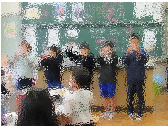
【人間もCO2を出しているんだね】

十一月一日にストップ温暖化教室がありました。CO2が増えないようにいろいろのことを教えてもらいました。空気よりCO2の方が重いことも実験で教えてもらいました。地球にCO2が無いとマイナス19度ぐらいになってしまふということも知りました。人間の息の中にもCO2があるので、削滅のため、家で冷ぞう庫を早く閉めたり、イオンモーターなどに出かけたときにはエレベーターじやなくて階段を使ったりしたいと思えます。みんなで協力してCO2をあまり出さないようにしていきたいです。