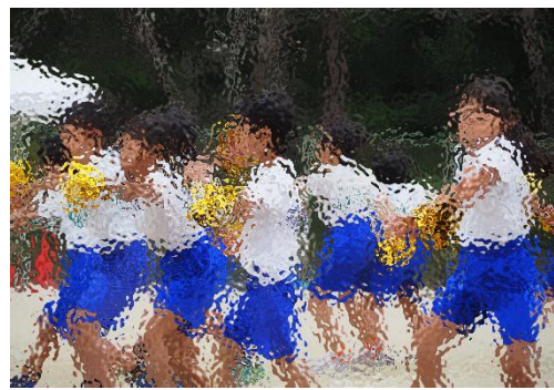
【1・2年：きざめ！ブラザービート】

運動会でいちばん楽しかったのはダンスです。「ミックスナッツ」も「私是最強」もすきな曲で、おどつて、とても楽しい気持ちになりました。何時間も練習して、おどりを覚えて曲を聞くとしぜん体が動くようになりました。本番はどきどきしたけど、たくさんの人にいちばんいいダンスを見てもらえてうれしかったです。来年の運動会もとても楽しみにです。