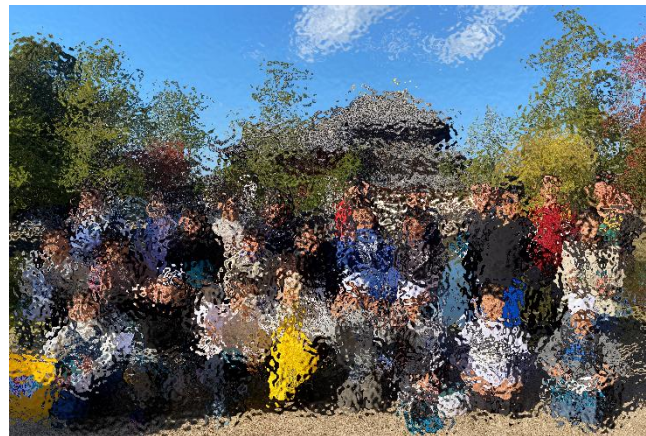
【奈良：東大寺 鏡池の前にて】

どれくらい時間がかかるのか気になりました。世界遺産が多い街の歴史をたくさん感じることができました。