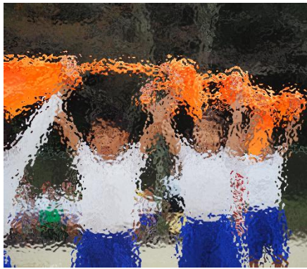
【3・4年：はじけるナッツ！ ～めざせ最強～】

です。学校や家で練習を続けたので、上手になっていくのがわかり、うれしくなりました。本番では、きんちゅうしてどきどきする気持ちもわくわくする気持ちもありました。心配になつたけど、手をグーにして自信をもつてがんばるしかないと言いつていたら楽しくなつてきて、無事終えることができました。五年生になつてもたくさん練習をして、みんなと合わせられるようにしたいです。