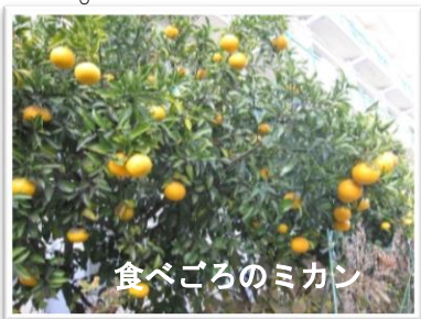
食べごろのミカン

さて、今年度の冬休みですが、自宅で過ごす時間が長くなるかと思えます。子供たちの会話からは、パソコンやスマホを利用したゲームの話をよく聞きます。冬休み中の家庭でのSNSの正しい使い方を、親子で確認していただくようお願いいたします。