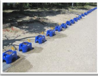
アサガオの鉢も ソーシャルディスタンス