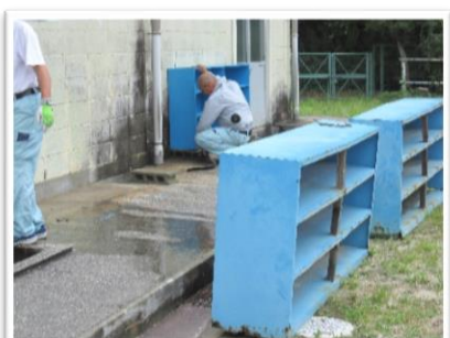
〈プール入り口下駄箱新調〉