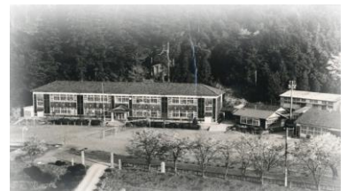
下山小・下山中の校舎 昭和45年