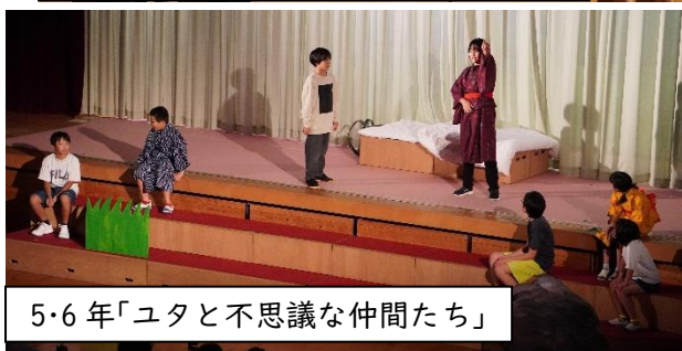
5・6年「ユタと不思議な仲間たち」