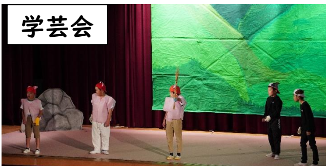
3・4年「3匹の子ぶたとおおかみ～その後～」