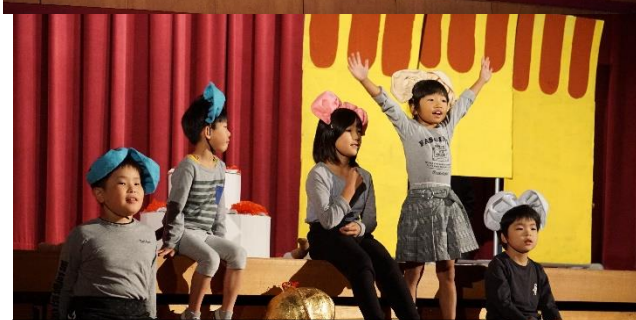
1・2年「ねこにすずをつけちゃった」