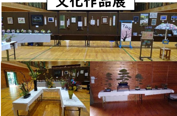
多くの方が参観してくださり、盛大に開催されました。学区の皆様、ありがとうございました。