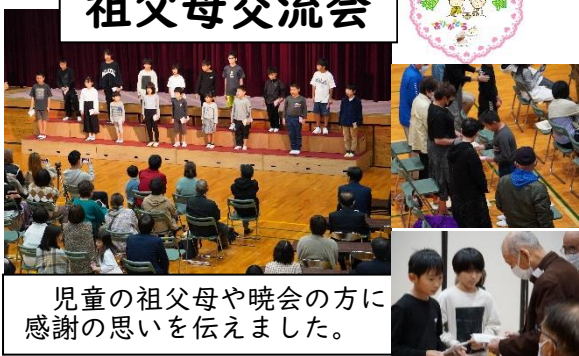
児童の祖父母や晩会の方に感謝の思いを伝えました。