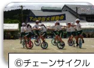
⑥チェーンサイクル