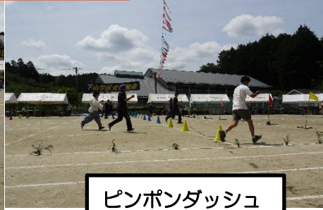
ピンポンダッシュ