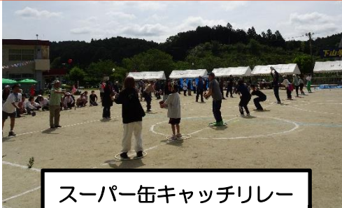
スーパー缶キャッチリレー