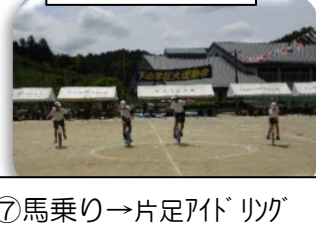
⑦馬乗り→片足アドリッパ