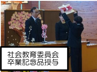
社会教育委員会 卒業記念品授与