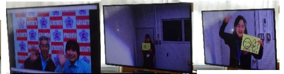
お世話になった先生方 からのメッセージ