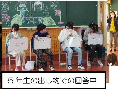
5年生の出し物での回答中