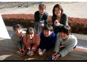
校長先生から 卒業生といっしょに 「ブリザードフラワー制作」 のプレゼント