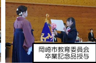
岡崎市教育委員会 卒業記念品授与