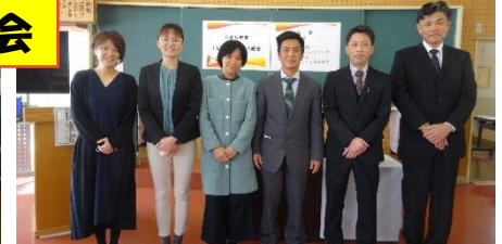
令和4年度PTA役員の皆様 ありがとうございました。