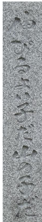
毫浦美問 揮杉立顔

陽光に照らされ、まぶしいばかりの木々の紅葉とともに、本校の輝かしい歴史を感じずにはいられません。