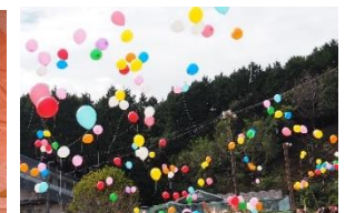
バルーンリリース

200名近くの方が参観していただき、盛大に開催されました。学区の皆様、ありがとうございました。