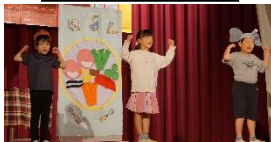
1・2 年「サラダ でげんき」