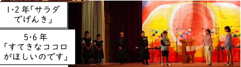
5・6 年 「すてきなココロ がほしいのです」