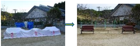
リフレッシュベンチ 2 基・ツイストベンチ 1 基