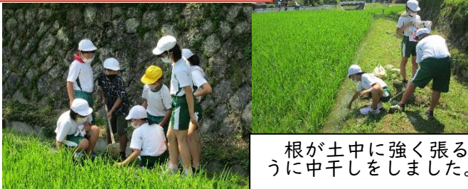
根が土中に強く張るように中干しをしました。