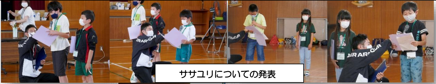
ササユリについての発表

6月20日(月)、3年ぶりの対面交流で学区のササユリを岡崎盲学校へ届けました。盲学校の子たちへ「ササユリがだんだん減っていて大切に守る必要がある」「甘い匂いを嗅いでファンになってほしい」など伝えることができました。その後、両校児童で3、4人グループを作り、ササユリを触って花びらの枚数を数えたり、匂いを嗅いだりして交流を深めました。