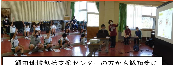
額田地域包括支援センターの方から認知症について学びました。