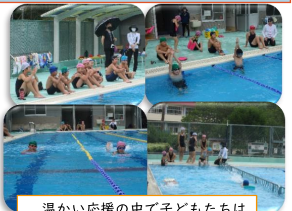
温かい応援の中で子どもたちは 全力で泳ぎました。