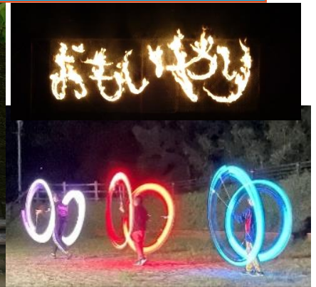
ケミカルライトによる火舞をしました。 3人の息があった演技で参観者を魅了。