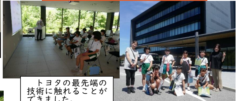
トヨタの最先端の技術に触れることができました。