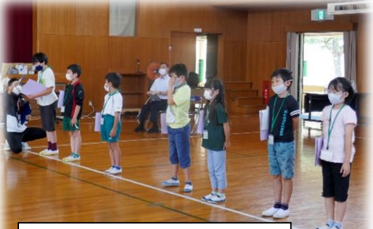
3年ぶりの対面交流。 下山小の保護活動を披露。