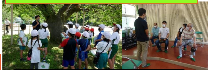
樹木医の方に、学校にある樹木(山桜)について、くわしく教えていただきました。