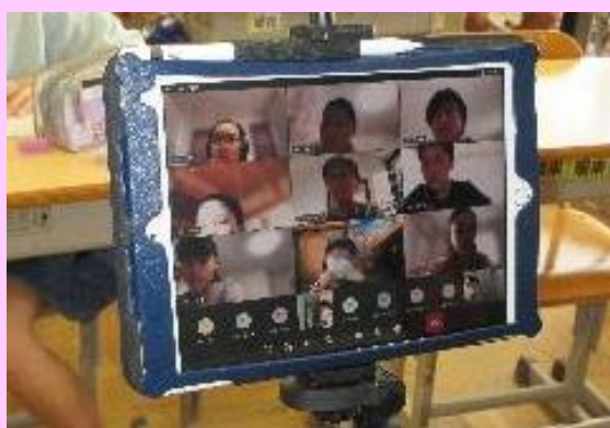
こんな「オンライン」から始まりました