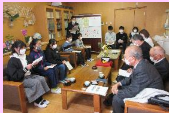
学校評議委員の皆様にご挨拶に6年生がスピーチ