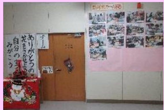
校長室、職員室の入り口の雰囲気です

校長室の入り口に各学級の取り組みの様子が伝わる写真を掲示し始めました。まだ全学級ではありませんが、個別懇談会までには撮影完了と思っています。ここでは、個人が特定できる写真を掲載できないので、雰囲気だけお伝えします。⇒ ⇒ ⇒ ⇒ ⇒ ⇒ ⇒ ⇒ ⇒