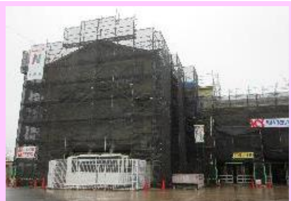
南校舎の外壁塗装工事の様子です