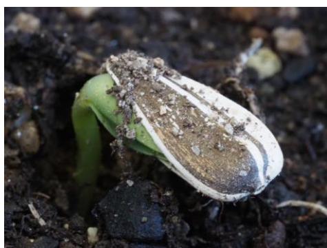
(朝 8 時撮影)