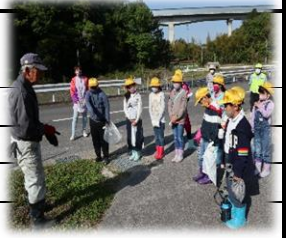
ふるさとの恵み わらびがり