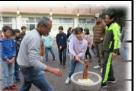
願いを込めて もち花づくり