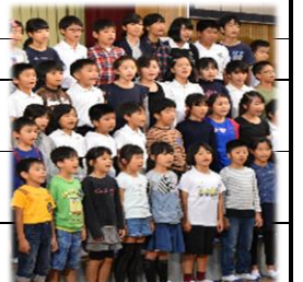
なりきる演技 学芸会