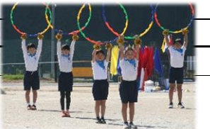
表現する楽しさ 運動会