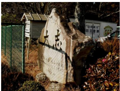
石碑「大志」 昭和 47 年建立 奥殿小創立 100 周年記念 香山中創立 25 周年記念