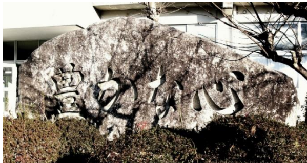
石碑「豊かな心」 昭和 51 年 3 月 19 日除幕