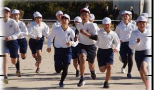
目標めざして マラソン大会