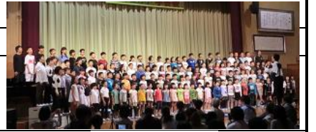
心をひとつに 学芸会