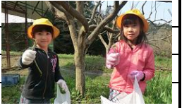
ふるさとの恵み わらびがり