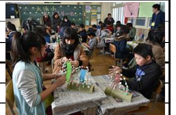
大浜小の子と一緒に もち花づくりの会