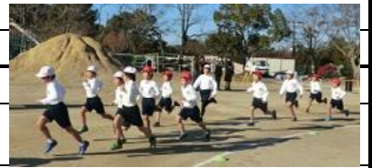
最後まで走りぬいた マラソン大会