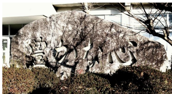
石碑「豊かな心」 昭和51年3月19日序幕