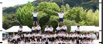
力を合わせて 運動会