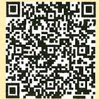
「ラーケーションの日」ポータルサイト

※ 県の Web ページ「ラーケーションの日」ポータルサイトには、計画づくりに活用できる「ラーケーションカード」や、様々な学びを体験できるスポットを紹介していますので、参考にしてください。