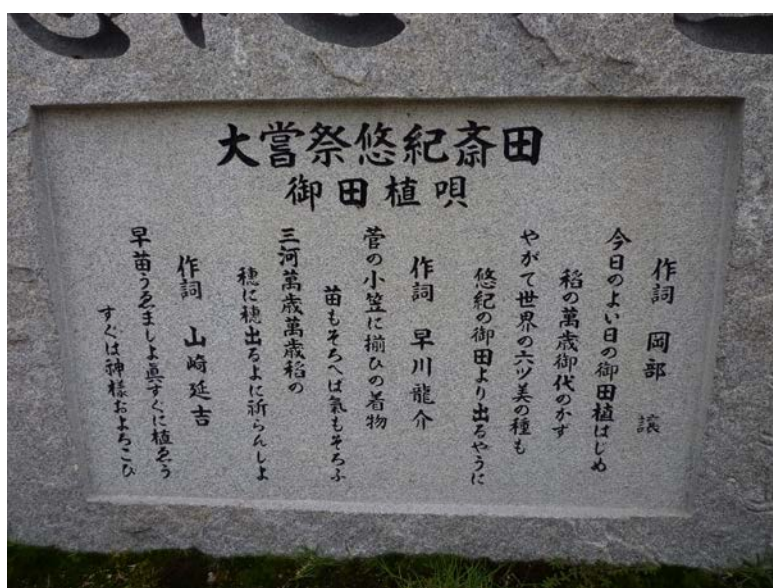
齋田地の記念碑 大嘗祭悠紀齋田 御田植え唄 2013(平成25)年 20160628