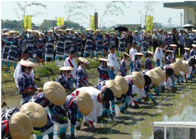
悠紀斎田お田植え2014