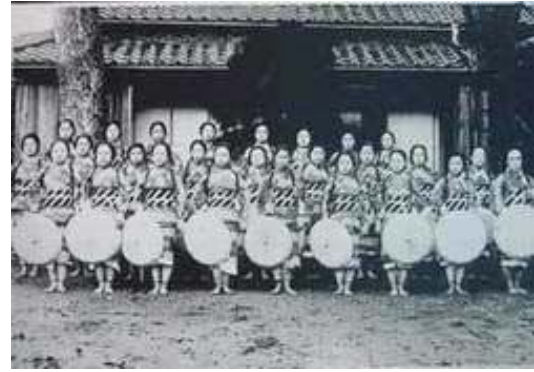
悠紀齋田大正時代5