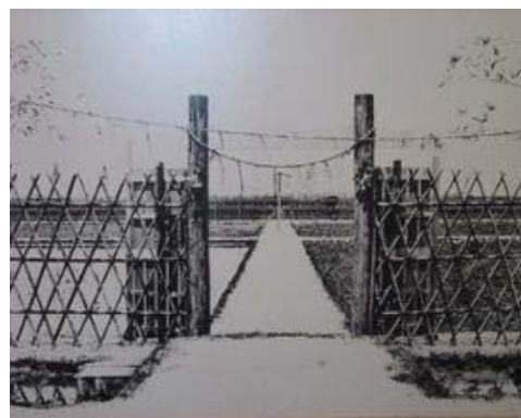
悠紀齋田大正時代1