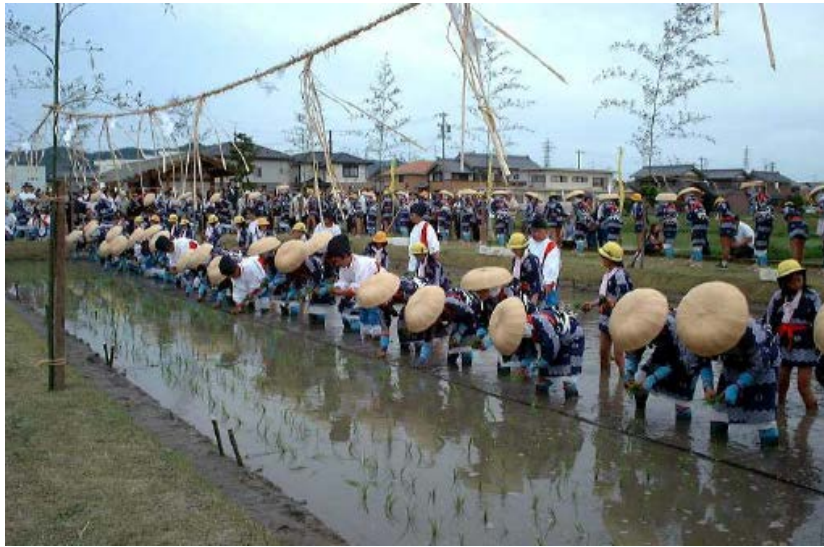
お田植え 2008 06