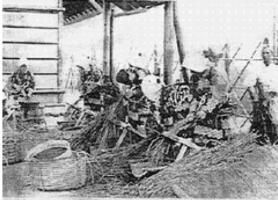
悠紀齋田大正時代6