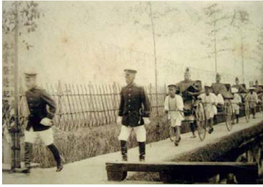
悠紀斎田と高橋用水