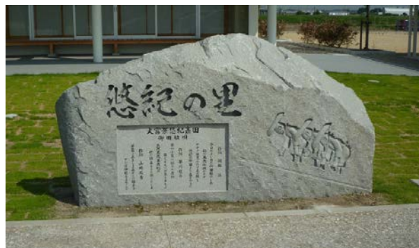
斎田地の記念碑 大嘗祭悠紀斎田 御田植唄 2013(平成25)年 20150731