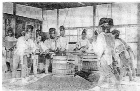
悠紀齋田大正時代3