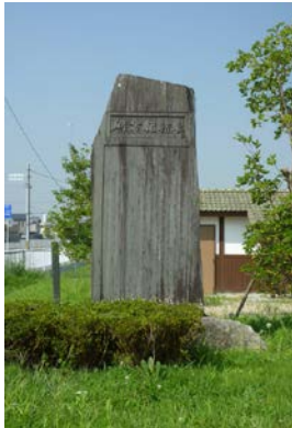
斎田地の記念碑 10周年記念 1916(大正5)年 20150731