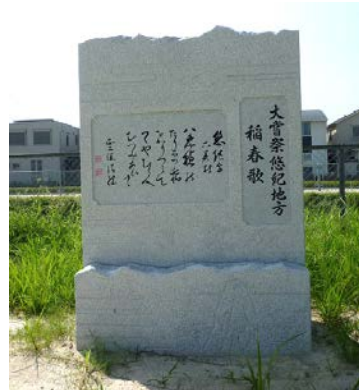
斎田地の記念碑 大嘗祭悠紀地方 稲春歌 2015(平成27)年 20150731