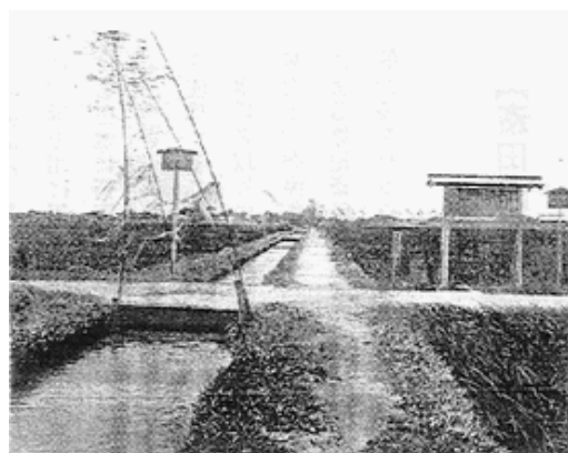
悠紀齋田大正時代2