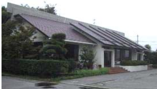
六ッ美民族資料館