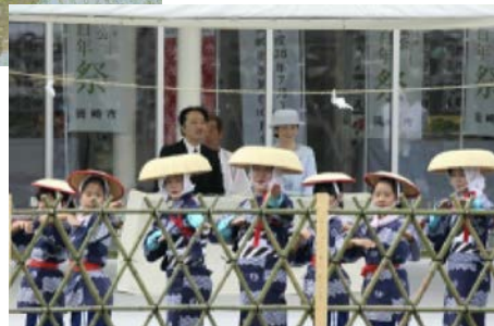
悠紀斎田お田植え2015