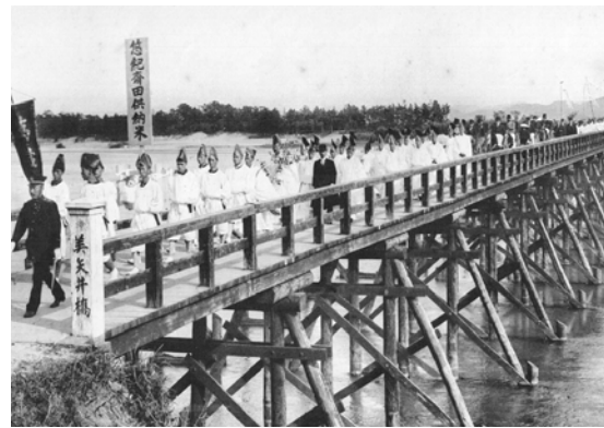
悠紀齋田大正時代7