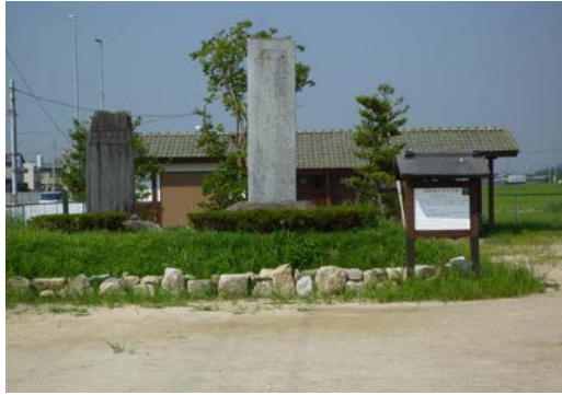
悠紀の里記念碑郡 20150731