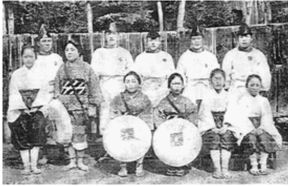
悠紀齋田大正時代4