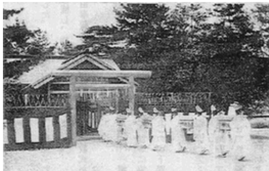
悠紀齋田大正時代10