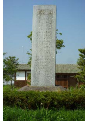
斎田地の記念碑 1916(大正5)年 20150731