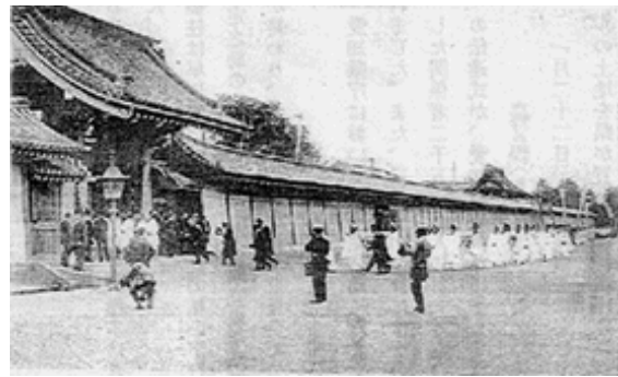
悠紀齋田大正時代9