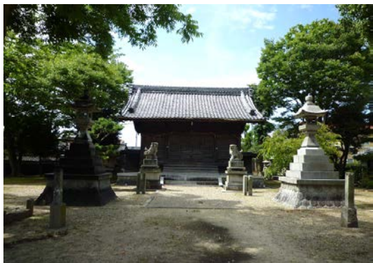
日長社 社殿 20150727