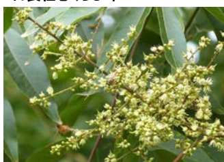
日長社 むくろじ 花