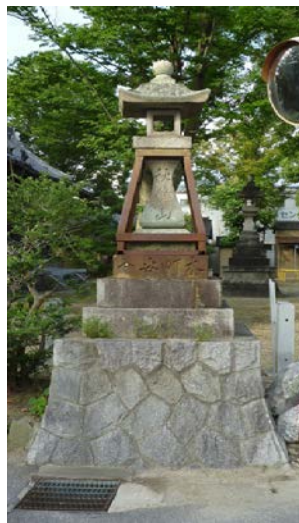
日長社 常夜灯 20150727