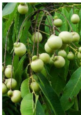
日長社 むくろじ 実