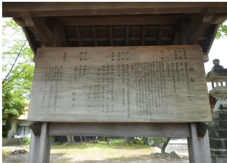
日長社 社記 160515