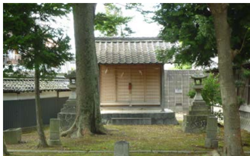
日長社 稻荷・琴平・猿田彦社 20150727