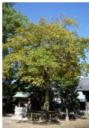
日長社 むくろじ 木 20151010