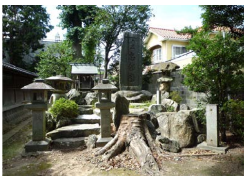
日長社 戦没者慰霊碑 20150727