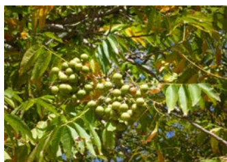
日長社 むくろじ 実 20151010