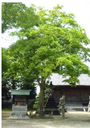
日長社 むくろじ 木 20150727