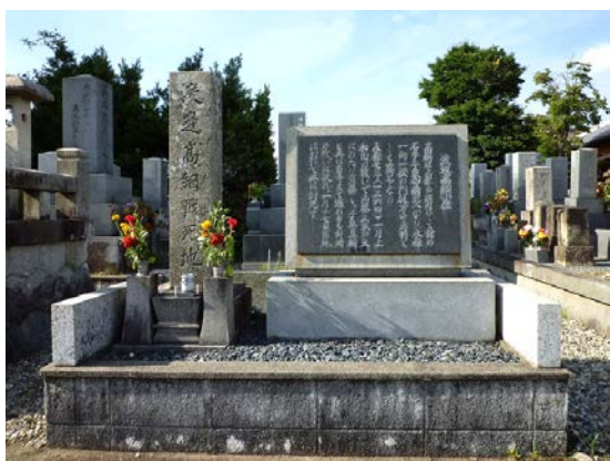
勝鬘寺：岡崎市針崎町朱印地3