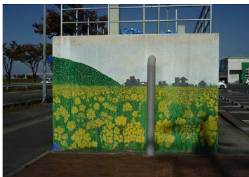
中継所C (南側) 20151028