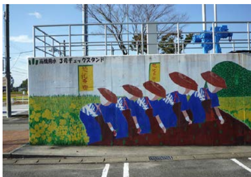
中継所C (東側) 20151028