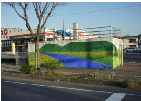
中継所C (西側) 20151028