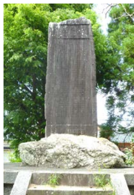
耕地整理記念碑 20150727 1905（明治38）年建立