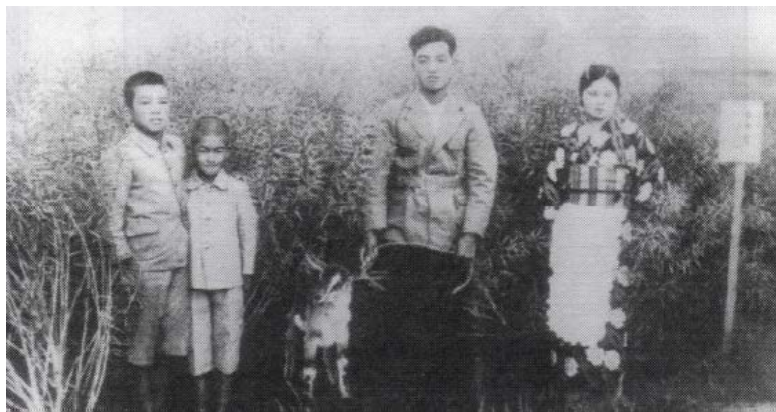
昭和初期の菜の花畑