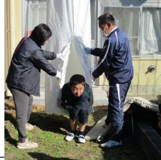
3階から救助袋をおろし、その中へ一人ずつ入って、「万歳」の姿勢で身を任せます。ゆっくり下りていきます。上靴が脱げる子も続出…