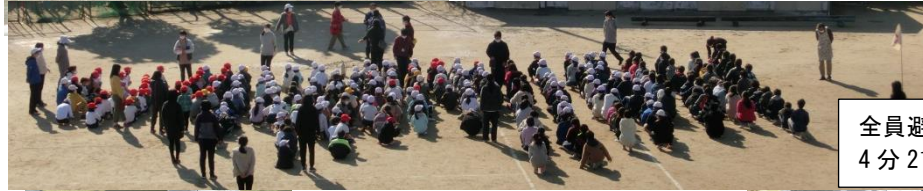
全員避難完了まで 4分21秒