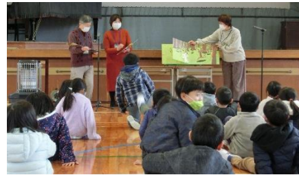
1月14日の緊急事態宣言を受け2月7日まで金曜日の読み聞かせは中止となります。