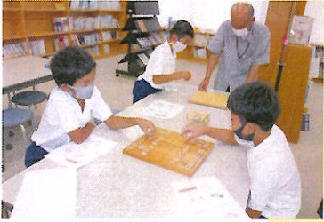
楽しいクラブ活動