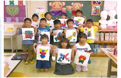
こんなのできたよ