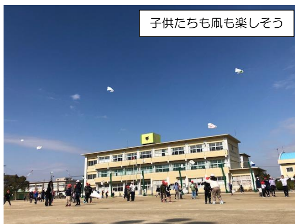
子供たちも凧も楽しそう

1年生と6年生の仲良しに加えて、快晴と絶好の風に恵まれました。どの子の凧も気持ちよさそうに揚がりました。こうして過ごした情景が、いつまでも子供たちの心に残っていることを願っています。