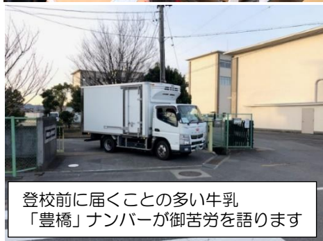
登校前に届くことの多い牛乳「豊橋」ナンバーが御苦勞を語ります

子供たちの学びや発達段階によって、こうした様々な人たちの営みは、その意味や価値が違って見えていたとは思いますが、感謝の気持ちは大切にしたいと思います。