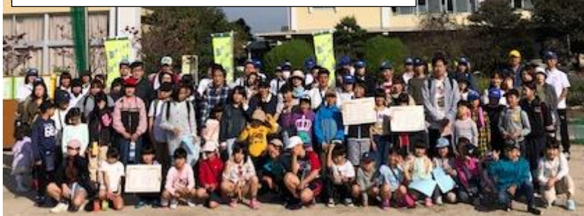
共に過ごした時間が、お互いと六ツ美中部を大切に思う気持ちを育んだことと思います。

晴天に恵まれて、「PTA親子にこにこコスモスウォーキング」を行うことができました。