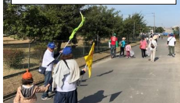
晴天のもと、親子の会話が弾みました。