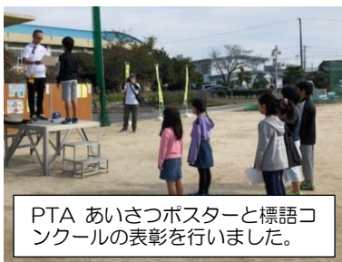
PTA あいさつポスターと標語コンクールの表彰を行いました。

また、この日はアサガオのツルも同時に使って、サツマイモのツルと合わせて、リース作りにも取り組みました。「生活（科）大好き」、思わず子供からもれた言葉でした。