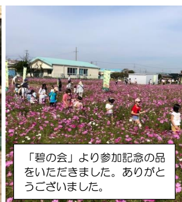
「碧の会」より参加記念の品をいただきました。ありがとうございました。