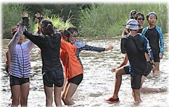
～思いっきり水遊び～

七月三日から五日まで、岡崎市少年自然の家へ山の学習に出かけた五年生。曇り空でスターとした一日目は、五年生パワーで予定通り日程をこなし、雨の二日目、三日目へと突入しました。 しかし、雨の中でも仲間とともに炊飯活動に挑戦したり、雨の音がする中でテント泊をしたりしました。まさに自然を肌で感じ取った二泊三日でした。