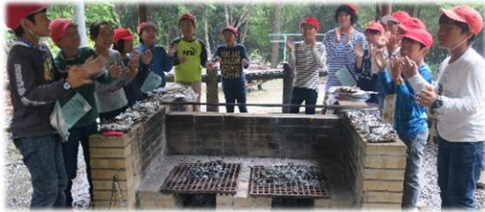
～3日目の朝食～ ちょっとこげたホットドック