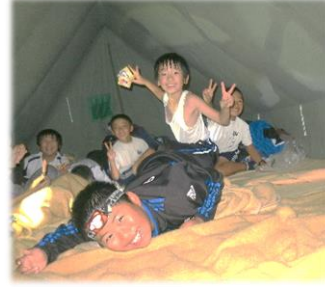
～2日目夜はテント泊～ 暑いテントの中でも 元気いっぱい